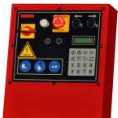
Управление MT150A с тачпадом, счетчиком деталей, установки стартовой и конечной точки и возможностью до 8 программ