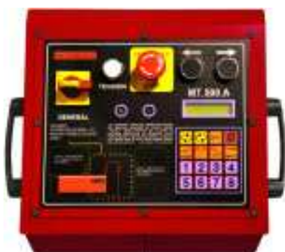
Управление MT500A с тачпадом, счетчиком деталей, установки стартовой и конечной точки и возможностью до 8 программ