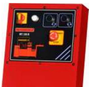
Управление MT150R с панелью и кнопками левого и правого закручивания